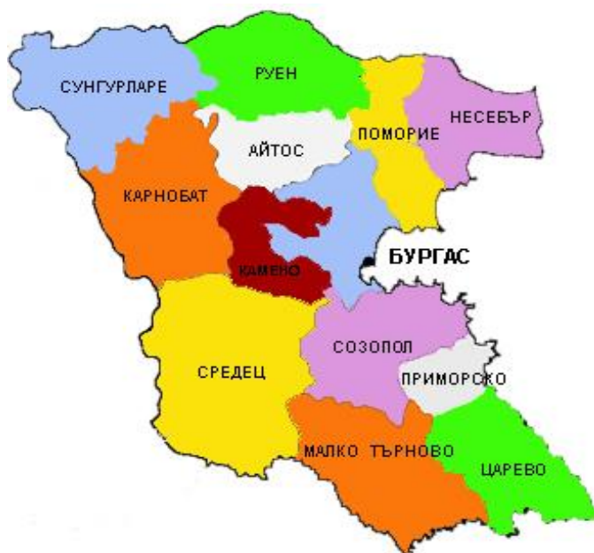
Фигура 1. Карта на област с административен център Бургас

Общата площ на общината е 530,1 кв. км., от които земеделски територии - 108,8 кв.км., горски територии - 401,7 кв.км., населени места и урбанизирани територии - 3,9 кв.км., водни площи - 2,8 кв.км., територии за добив на полезни изкопаеми - 11,3 кв.км., територии за транспорт и инфраструктура - 1,8 кв.км. Плажни ивици - 19 с обща площ 349,2 кв. м., обща дължина 9 184м. и средна ширина 33,6м. Населението на общината е 9621 души. Климатът е преходно - средиземноморски. Релеф и природни ресурси са уникално съчетание на море, планина и реки с екзотична растителност и многообразие на животински видове. Най - голямата странджанска река Велека с дължина 147км. Реката е плавателна в последните си 10км. Река Караач, р.Резвая,